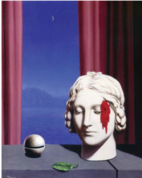
Figura 1 - La mémoire , René Magritte

Essa estória é menor pois está na língua informacional como uma estrangeira, uma estranha nas cercanias da forma ( eidōs | ousía ) e das formações do sentido da pólis . Uma estória deslocada nos refúgios da língua maior da informação, entre apagamentos e rasuras, extenuações e repressões. São Deleuze e Guattari (1977), a partir da literatura de Kafka, os inventivos criadores do conceito “menor”, intensivamente usado no campo da Biblioteconomia e Ciência da Informação (BCI) por Solange Mostafa (2011; 2018). Deleuze e Guattari recordam que Kafka nos dizia que a literatura tem a ver com o povo e não com a história (literária), logo, a estória menor do conceito de informação aqui abordada diz respeito às memórias do povo socialmente oprimido e obliterado da história ontológica e seus traços informacionais.