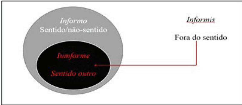
Figura II – Semiofagia da informação