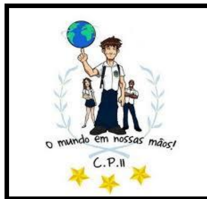
Figura 3: Brasão do Colégio elaborado pelos alunos.