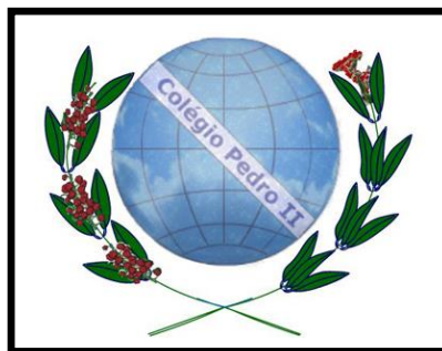
Figura 5: Logo versão em azul.