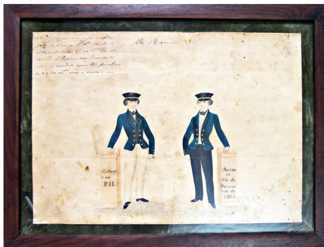
Figura 12: Primeiro uniforme do Colégio.