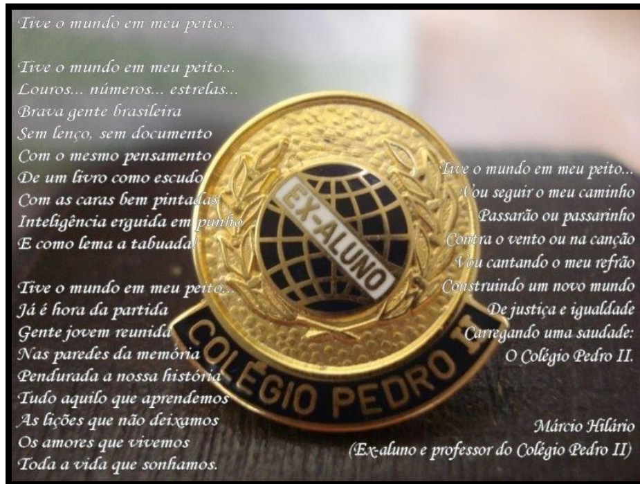
Figura 4: Poema de ex-aluno dedicado ao Colégio e à comunidade escolar.