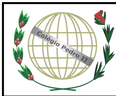
Figura 6: Logo versão em amarelo.