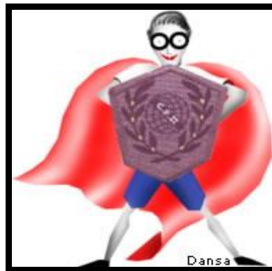
Figura 2: Emblema do Colégio como símbolo de força e poder.

Curioso destacar, ainda, outras diferentes formas de manifestações vindas da comunidade discente que evidenciam a importância desta instituição não só para a sua formação acadêmica, mas, principalmente, como lugar comum de suas lembranças e formador de sua identidade. Na figura abaixo, identificamos uma reprodução do emblema do Colégio Pedro II, elaborado por seus alunos, que descreve, pontualmente, a relação e os laços de pertencimento dos mesmos à Instituição. Verificamos que o aluno, uniformizado com trajes nas cores do Colégio: azul e branco, representa um Super-Herói, devidamente, protegido por sua capa e por seu escudo, simbolizado aqui pelo emblema do Colégio. Todo Super-Herói é encorajado a desvendar o mundo e tem por missão salvar o planeta, mas este, em especial, expressa sua força e poder, tendo em sua defesa o escudo da Instituição que irá protegê-lo dos inimigos e dos perigos que enfrentará em suas lutas diárias.