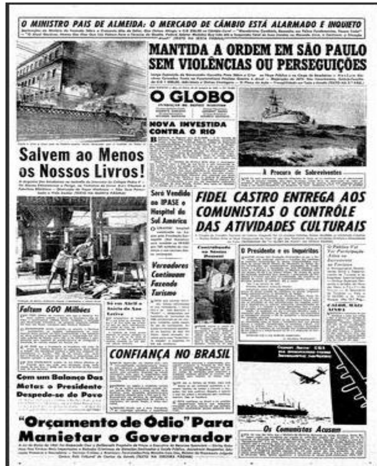
Fonte: Jornal O Globo, 18 de janeiro de 1961, Edições Matutinas, Geral, p.1.

Na primeira imagem da capa do jornal “O Globo”, podemos observar, logo de início, o subtítulo da figura: “Cento e vinte e cinco anos de história escolar foram devorados com o incêndio do Pedro II.” Destaca-se, ainda: “A Angústia dos estudantes no incêndio do Internato do Colégio Pedro II – os alunos enfrentavam o perigo, na tentativa de livrar das chamas a fabulosa biblioteca – destruição de peças históricas – não será perturbada a vida escolar”. (JORNAL O GLOBO, 1961, p. 1).