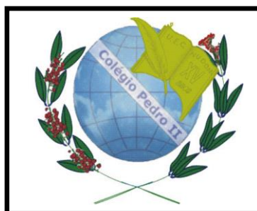
Figura 10: Logo do NUDOM.