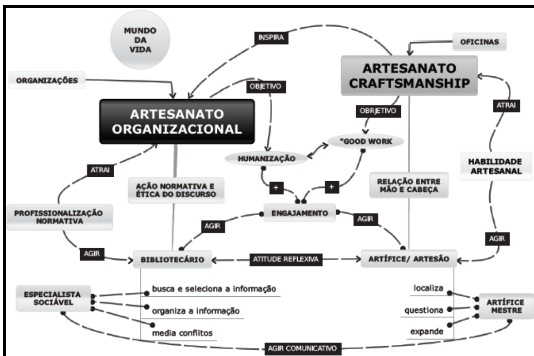
Figura 2: Mapa conceitual Artesanato organizacional

A construção do mapa conceitual abaixo (Figura 2) foi uma tentativa de apresentar o artesanato organizacional e suas relações no mundo da vida. A tentativa de construção desse conceito partiu da inspiração do artesanato desenvolvido nas antigas oficinas/ guildas da Idade Média apresentado por Sennet em seu livro “O artífice”.